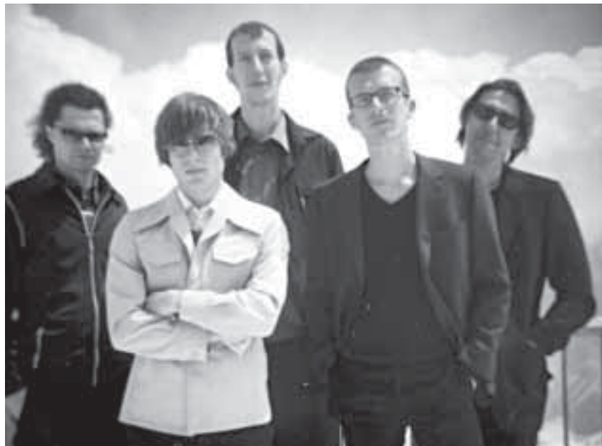
Treten im März im Jazzkombinat im Prager Frühling in München-Schwabing auf: die Gruppe Hipnosis mit frischen jungen Tönen.