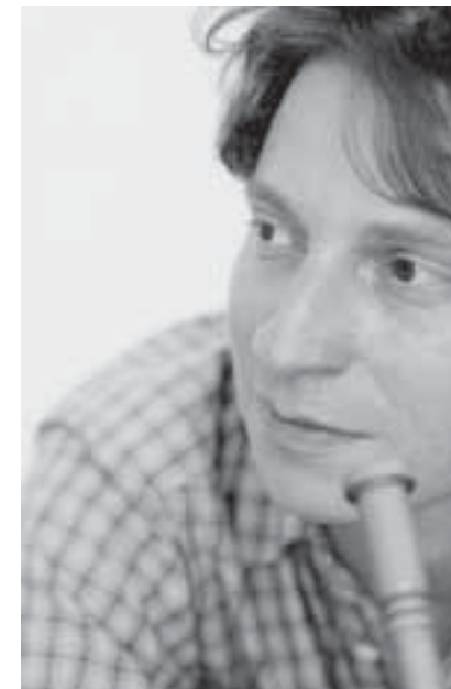
Rising Star Gerard Presencer im Birdland Neuburg, Ufa München...