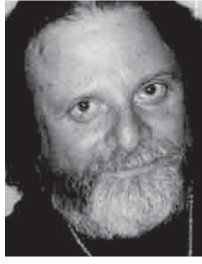
Richie Beirach in Bayern (J.I.M.-Festival)

Im September kommt das BuJazzO zu seiner 30. Arbeitsphase zusammen. Erstmals schlagen sie ihre Zelte in der Musikakademie Rheinsberg auf. Im neu erbauten Künstlerhaus verfügen sie über optimale Bedingungen und die Spielstätten kann man sich romantischer nicht vorstellen. Nicht umsonst hat Tucholsky seinen legendären Roman „Rheinsberg. Ein Bilderbuch für Verliebte“ hier angesiedelt. Und wie in jeder Arbeitsphase gibt es auch