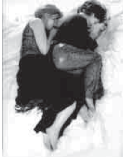
Kuscheljazz: 2 souls in 1 (Hamburg)