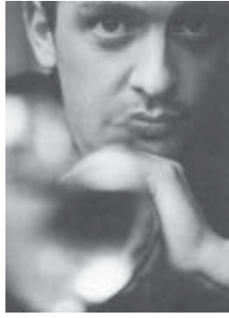
Till Brönner auf „Blue Eyed Soul“-Tour