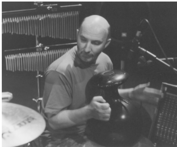
Die Levante in den Alpen: Beim 4. Jazztival auf Schloss Elmau sind Theodosii Spassov (li.) und Kornel Horvath zu hören.

D ass auch Count Basie quietschfidel im Jazzlaboratorium umhergeistert, macht die Count Basie Big Band deutlich, die noch immer zu den Besten ihres Fachs zählt: am 7.11. unter dem Motto „teatime music“ im Münchner Kulturzentrum Gasteig, dann am 15.11. im Birdland in Neuburg/Donau ( www.birdland.de ).