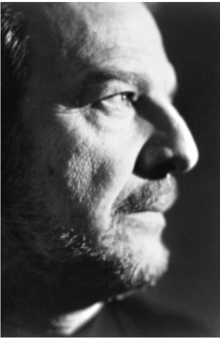
Er war viele Jahre Astor Piazzollas Partner: Pianist Pablo Ziegler